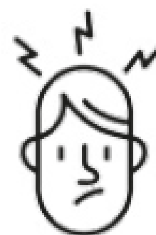
Maux de tête