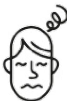
Vertiges / Nausées